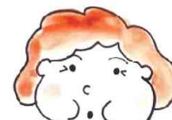
口をすぼめて ウー イー