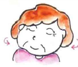
首の体操 右に左に ぐるりと回して