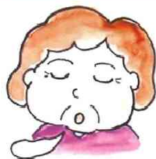
深呼吸 吸って吐いて