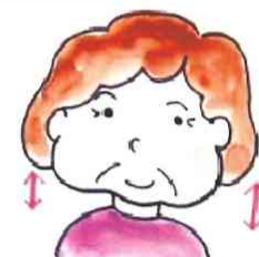
肩を上げて下げて