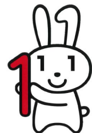
愛称：マイナちゃん