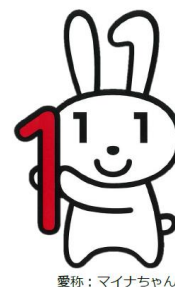
愛称：マイナちゃん

さらに、来年7月から予定されております地方公共団体等との情報連携開始に向けて、本年度中に本組合加入者全員の個人番号を取得する必要があり、当初は加入者の皆様から直接、個人番号の提供をお願いする予定としておりました。しかし、 収集作業の負担軽減、正確性・安全性を期するために厚労省から示された、住基ネットから個人番号を取得する方法を採用することとしました。