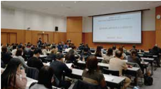
たくさんの方が受講された

X線診断においては、歯根長1/3以上の骨吸収を重症(gravis型歯周炎)の目安とし、1/3未満を軽症(levis型歯周炎)と判断する。全顎的な印象に左右されるのではなく、1歯ごとに骨吸収量、垂直性欠損、根分岐部病変の有無を個別に評価することが重要であるとされた。特に隣接面の楔状吸収や分岐部2～3度病変(gravis-complicata型歯周炎)は、治療難易度を大きく左右する所見として重視された。