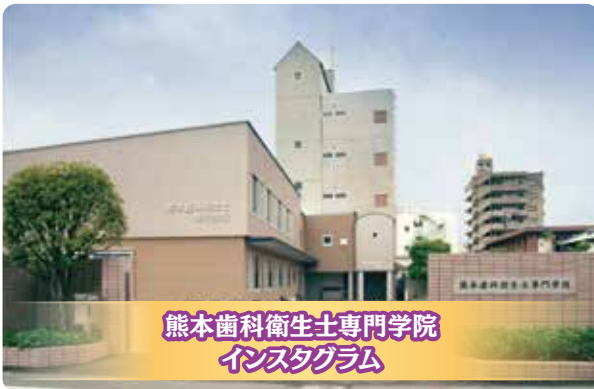
熊本歯科衛生士専門学院 Instagram