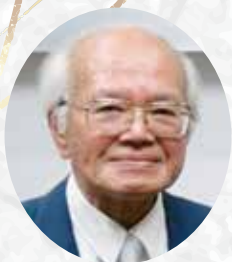
瑞宝双光章 矢毛石 陸男 会員