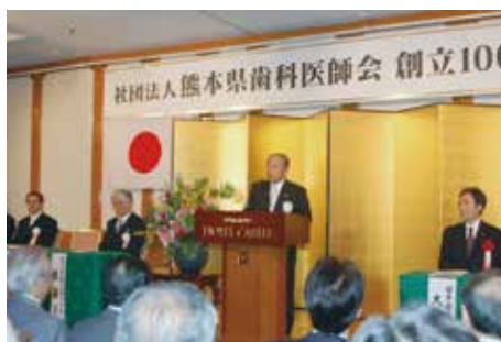
熊本県歯科医師会100周年記念式典の挨拶

今でこそ、マイナンバーカードによるオンライン資格確認が当たり前の時代となりましたが、当時はまさに「海のものとも山のものともつかぬ」未知の領域でした。厚生省や社会保険庁、保険課などの行政機関との折衝、そして何より会員の先生方への説明と協力要請。現場の混乱を最小限に抑えつつ、国の医療DXの礎を築くための調査研究に従事いたしました。