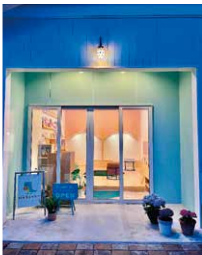
歯科医院隣接の「絵本屋よかよか」

熊本は、こどものむし歯が多い地域だと言われてきました。昨年末の新聞では、熊本市のデータではありますが、政令指定都市の中で“ワースト”を脱出した、という明るいニュースもありました。それでも現場にいと、治療が必要になってから初めて歯医者に来る、というケースはまだ少なくありません。歯科医師として強く感じているのは、予防は歯医者の中だけでは完結しないということです。歯を大切にする気持ちは、治療を受けてから身につくのではなく、もっと日常の中で、自然に育っていくものだと思うようになりました。