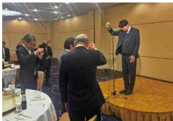
工藤県歯副会長のご発声により、乾杯