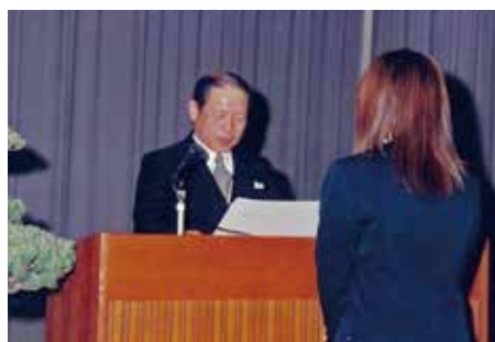
歯科衛生士専門学院卒業式卒業証書授与