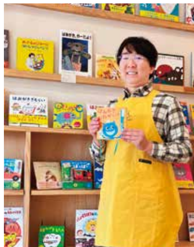
絵本を通して歯に興味を持ってもらえるようにディスプレイしています

絵本を通して歯のことを知り、歯医者に通うこどもたちが増えていく。その先に、熊本のこどもたちのむし歯が、全国でいちばん少なくなる日が来たら。「絵本屋よかよか」「合志かたやまこども歯科」は、そんな未来を目指しています。