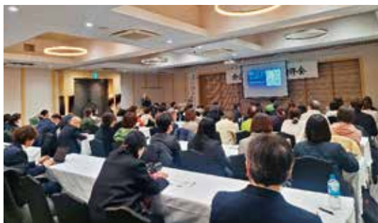
歯科関係者以外のたくさんの方にもご参加いただいた

講演では、口腔内は細菌が多いが全て除去する必要はなく、口腔ケアはプラークコントロールを行うことで口腔内の細菌数のバランスを保つという主旨で行うと良い。また口腔ケアは全身疾患にも影響すると言われているが、口腔内の汚れは洗口剤などでは除去しきれないので、歯ブラシによる機械的な清掃が重要である。そして経口摂取を行わなくなった症例では、口腔内の汚染が重篤化しやすく、他者介入による口腔ケアがさらに必要となるとの話があった。