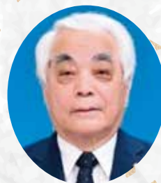
瑞宝双光章 赤城 公德 会員