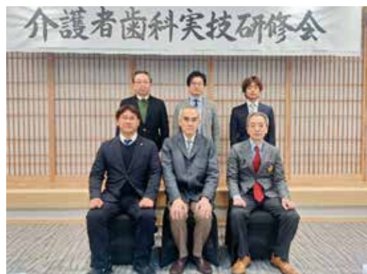
研修会は無事に終了した

また、総義歯の症例でも、義歯の汚れが歯肉の炎症や誤嚥性の肺炎のリスクになるため、定期的な歯科受診を行い、義歯洗浄を行うことが重要であること、さらに肺炎予防には口腔ケアと併せて栄養摂取が重要で、肉や魚といったタンパク質摂取には咀嚼食塊形成といった口腔機能も重要になり、口腔機能の低下は栄養摂取のみならず、窒息のリスク増加にもつながることから口腔機能管理も重要となってくる。また、動揺歯や補綴物の脱離等で誤飲や誤嚥の事故も介護の現場では起こるので、口腔ケアしながら動揺歯や補綴物の脱離の確認等も必要であり、定期的な歯科受診も効果的である。さらに要介護高齢者は口腔乾燥の症例も少なくないので、口腔ケアを行う際には保湿を行うことも重要である等の話があった。