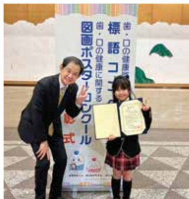
牛島県歯会長と記念撮影