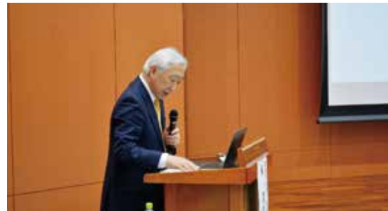
講演される東院長

根分岐部病変は歯周治療において最も管理が難しい領域であり、保存的アプローチを基本とする。ヘミセクションやトライセクションは適応を厳選し、術後は連結などにより機能維持を図る必要がある。再生療法は、十分なプラークコントロールと出血抑制が前提条件であり、拙速な介入は避けるべきとされた。