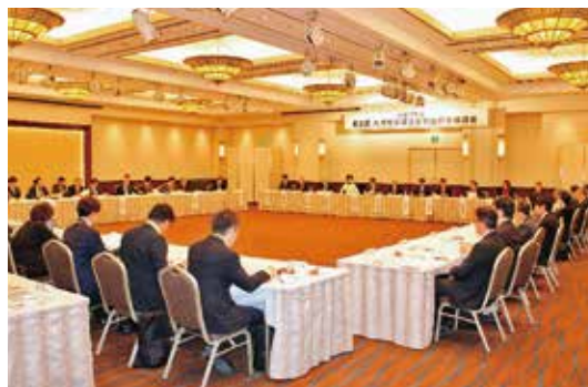
63人が参加し、活発な意見交換が行われた