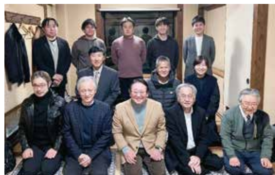
晴れやかに、令和8年の幕開け

また本年は新入会員も加わり、支部として新たな仲間を迎えての明るいスタートとなった。今後も会員相互の連携を深めながら、地域歯科医療の発展と住民の口腔と全身の健康の向上に努めていく決意を新たにす有意義な新年会となった。