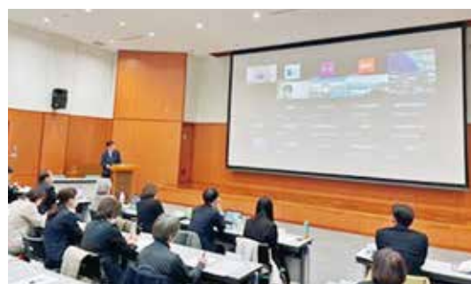
ハイブリッド式で開催され、活発な意見交換が行われた

今回の会議を通じ、フッ化物洗口を含む学校歯科保健活動の推進には、主体となる学校現場を中心に、学校歯科医、行政、教育現場が相互に連携し、地域や学校規模に応じた支援体制を構築していくことの重要性が改めて確認された。今後も関係機関が協力しながら、持続可能な学校歯科保健活動の推進が求められる。