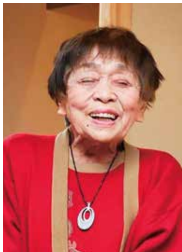
閉院後、大学同窓会にて挨拶

52年9月に現在地で開業。歯科医を始めた頃から20年後の違いを、しみじみと噛み締めました。平成26年にはお湯が出るスケーラーができ、冬場や知覚過敏の患者さんからは、とても喜ばれました。そして知らぬ間に、熊本県下で女性最高齢の現役歯科医師に。レントゲンもデジタル化を考えた時もありましたが、閉院する最後までアナログを使用し続けました。開業後、間もないころでした。レントゲンの暗室での手現像から昭和55年に注射器による現像液注入のインスタントフィルムが発売され、さらに昭和58年にはプッシャー式で直接注入する方法へ。現在もまだあるそうです。キャストは1907年(明治40年)にインレー体がシカゴの歯科医師により作られ、歯科治療が劇的に変革。平成24年の大阪歯科大刊行本に昭和14～5年頃の技工実習の写真があり、目に止まりました。私も昭和40年まで使用していました。40年後半頃、遠心・吸引鑄造機に代わって行きました。令和6年4月30日(92才)で閉院。あっという間の(再開業の)47年、戦後に原始的な機械を使って苦勞しながら診療してきた、最後の世代の歯科医師だったかもしれません。