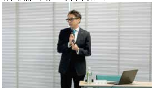
明日からの診療に役立てられるように

補綴装置・歯科材料の誤飲・誤嚥、術中・術後出血、上顎洞穿孔、異物迷入、神経麻痺、神経損傷、気腫、顎関節脱臼などについて