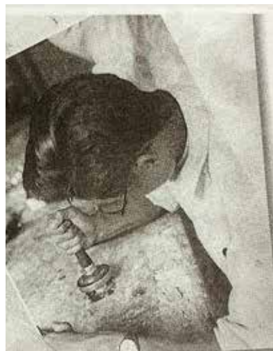
圧迫キャストを私も昭和40年まで使用した

昭和32年、大阪歯科大学を卒業し国家試験に無事合格、人吉に帰郷。父と共に診療開始。大阪と人吉の大差に驚き、水道がない、ガスがない。うがい用のコップには、ヤカンから水を注ぎ、形成時には注射器からポタポタと水を落とし、綿球で吸水する始末。電気エンジンは15,000回転位の3段式滑車ベルト。火の使用はアルコールランプです。咬合面バンドの溶接によるサンブラ冠、いわゆるバケツ冠はエリートセメントとの相性は良く、30年後に外しても歯頸部う蝕はありませんでした。人吉に10軒ほどある歯科医院の中でも、レントゲンがあるのは当時の公立病院とあと一軒なので、実家に戻る条件としてレントゲンを入れて貰いました。昭和31年頃、人吉市に水道導入。昭和35年頃ようやく実家の町内にも水道工事が始まり、1番に工事を入れました。「水を金で買うのか」と言われましたが、診療椅子の使えなかった給水排唾が