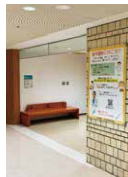
A0版の大きなポスターである (841mm×1189mm)