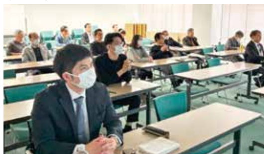
日曜日の午前中であつたが多くの参加者が学んだ

口腔外科専門医としての臨床の実際に加え、県歯医療対策委員会理事としての経験を踏まえ、実際の症例や医事紛争事例も交えながら、日常診療に即した内容をわかりやすくご講演いただいた。誰もが偶発症や医療事故、医療トラブルを起こしたわけではない。しかし、万一起こった際には、適切な対応と適切な説明を行うことが医療従事者の使命である。本講演の内容を日々の診療に役立てていただき、安心・安全な歯科診療につなげていただければと思う。最後に宇治専務理事より閉会の言葉をいただき、盛会のうちに閉会となった。