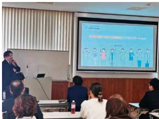
口腔機能低下症を深く理解することができた

口腔機能低下症は高齢化が進む中で、今後ますます重要となる分野であり、日常診療に取り入れる必要性を強く感じる講演会であった。