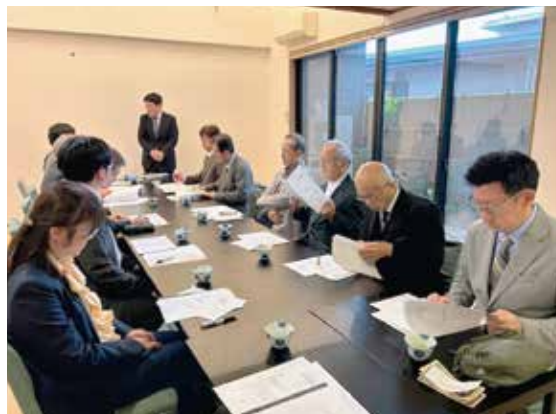
事業報告と議事の審議が行われた