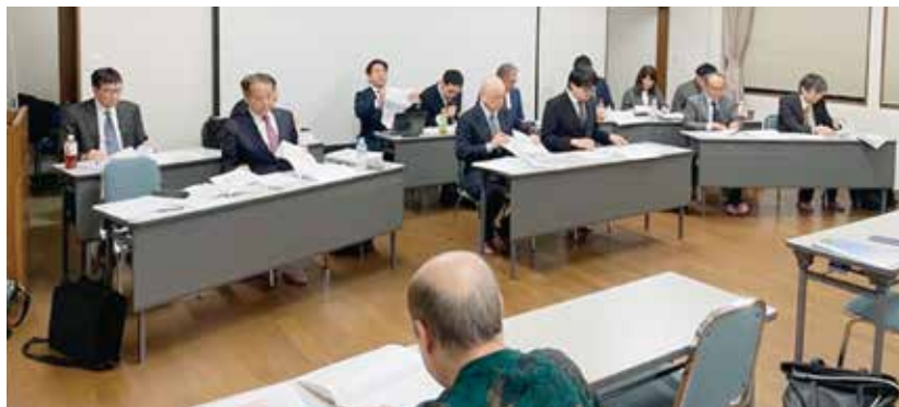
新年度スタートに向けて充実した議論が行われた

充実した議論の中で、事業計画、予算が無事に承認され、令和8年度スタートの準備を整えることが出来た。