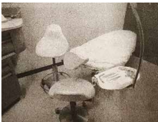
我が奥田歯科クリニックで開業時から使っているデンタル ベッド。診療台の回りにうがいをする所や機械類がなくス ッキリしている…

〈これら、水平位診療のノウハウは、私を題材にして「GP」という季刊本に連載された。〉