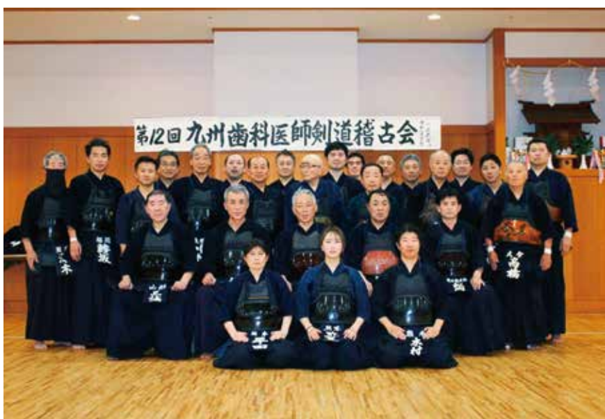
九州各県からたくさんの方が稽古会に参加された