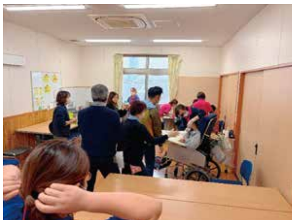
障がい者入所施設での歯科検診・保健指導

また、くまもと江津湖療育センター外来棟においては、「重症児(者)の摂食嚥下リハビリテーションと口腔ケアについて」と題した講演会を実施し、摂食嚥下に関する講義に加え実技指導も行った。