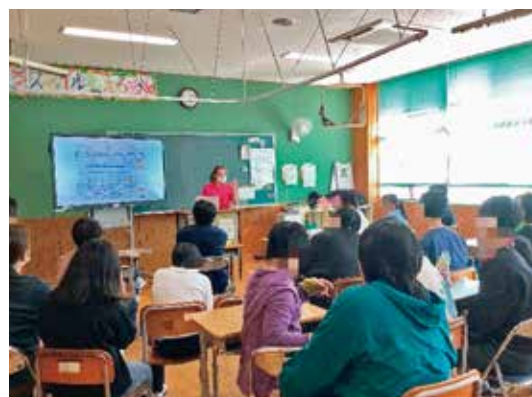
特別支援学校での歯科保健指導を授業形式で行った

施設での歯科健診では、利用者の口腔内状態を評価し、その結果を施設職員や保護者へ共有することで、歯科受診への動機づけを図っている。これにより、う蝕や歯周病の早期発見・早期対応につながっており、利用者の多くが積極的に健診を受けている。