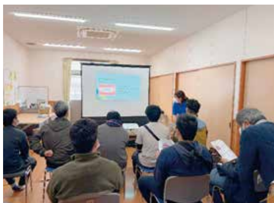
障がい者入所施設の職員にむけた口腔管理の研修会

口腔保健センターでは、障がい者施設および支援学校を対象に、歯科健診・歯科保健指導・講演会を継続して実施している。あわせて、軽度障がいのある方が一般歯科医院でも円滑に歯科診療を受けられるよう、登録歯科医制度による体制整備と研修会の開催にも取り組んでいる。