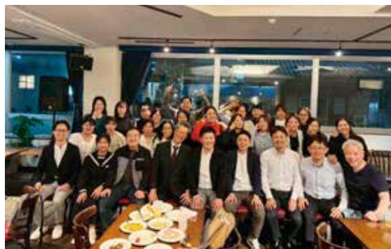
とても楽しいひと時を過ごせた

普段、他院のスタッフと直接顔を合わせる機会は決して多くない。しかし今回の会は、それぞれの現場で歯科医療を支える仲間との繋がりを肌で感じる機会となり、極めて有意義な一日となった。