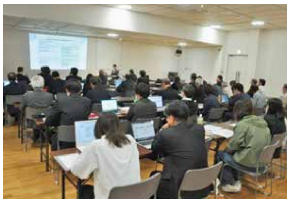
保険改定説明会の聴講中

時代に合わせて複雑化する保険改定の詳細やルールをまだ掴めきれない中、丁寧にご説明頂いた。約2時間の講演の後、午後4時30分より通常総会が執り行われた。松本会長のご挨拶では人口減少が進む天草郡市での歯科の重要性を述べられ、身が引き締まる思いであった。