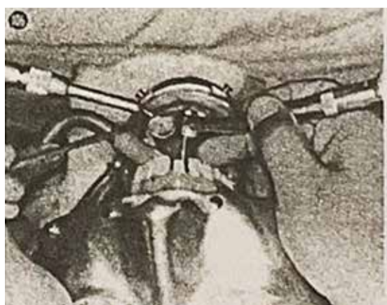
歯牙を削る際の右手中指のレストポジション、バキュームの 位置…これが基本である

〈これら、水平位診療のノウハウは、私を題材にして「GP」という季刊本に連載された。〉