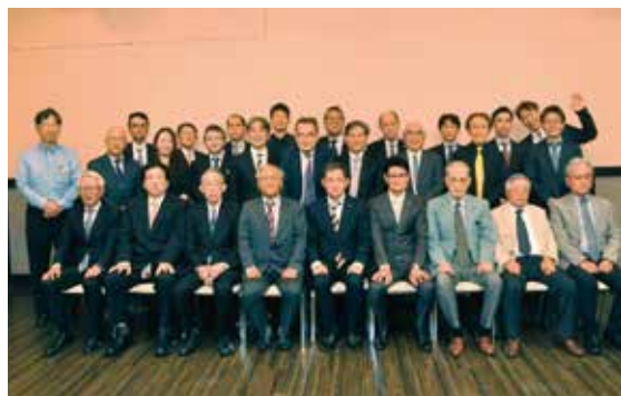
本年度も天草郡市歯科医師会 頑張っていきましょう!