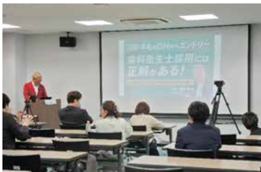
ハイブリッド方式で講演会は開催された

まず、歯科衛生士の有効求人倍率は全国平均で23.7倍と非常に高く、極めて厳しい採用環境にあることが示された。また、地域によっては就業者数が減少している一方で、診療所数も減少傾向にあり、今後も人材確保の重要性が一層高まることが指摘された。