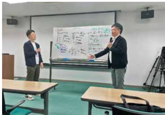
角先生の講演は強い説得力が感じられた

講演の内容は、まず個人の自己肯定感を高めることから始まり、そこから院内スタッフの精神性を引き上げ、最終的に患者満足度の向上へと繋げるという、画期的なものであった。一見すると魔法のような劇的な変化を説きながらも、その実、非常に論理的で納得感があり、明日からの診療現場ですぐに実践できる素晴らしい内容であった。