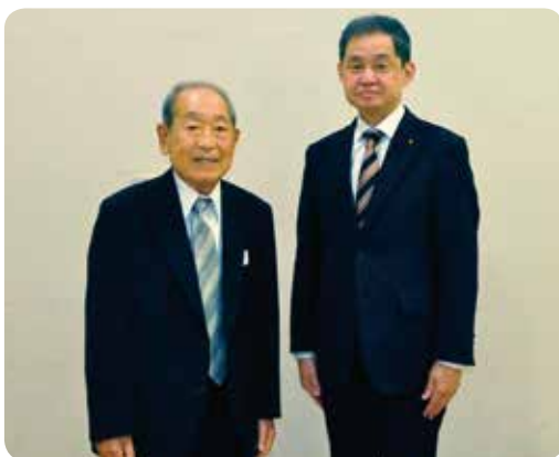
青砥忠孝会員の長年の功績を称えて