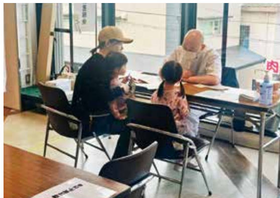
本会の歯科相談ブースの風景

最後にくまモンも来場し、子供たちと共に歯みがき体操、くまモン体操を行い大盛況であった。