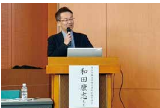
参加者に向けて分かりやすく解説する和田歯科医療管理官

和田歯科医療管理官からは、歯科固有の技術料の見直し（歯周病治療の体系化、口腔機能低下症の検査要件明確化、有床義歯の管理評価への見直し等）、脱金属と医療DXの推進（CAD/CAM冠の適用制限の事実上撤廃、定例報告の廃止、マイナ保険証・電子処方箋等の導入評価）、そして医科歯科連携の新たな評価（歯科からのフィードバックに対する医科側への算定枠新設等）に関するご講演があった。